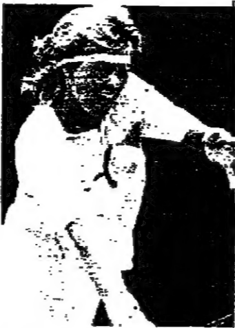
لبنانية بريندا شولتز في مبارياتها والفرنسية غراف في بطولة استراليا المفتوحة